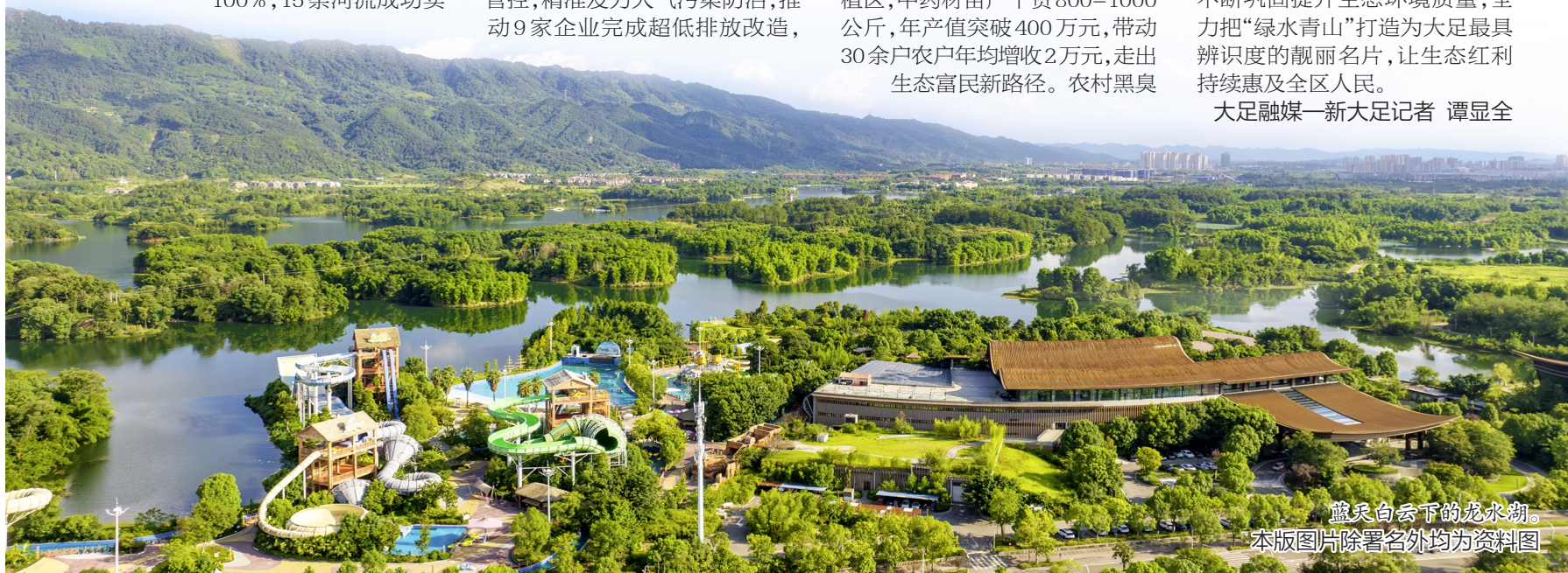
蓝天白云下的龙水湖。 本版图片除署名外均为资料图