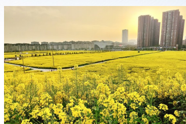
智凤街道田野公园，连片的油菜花吸引市民打卡。