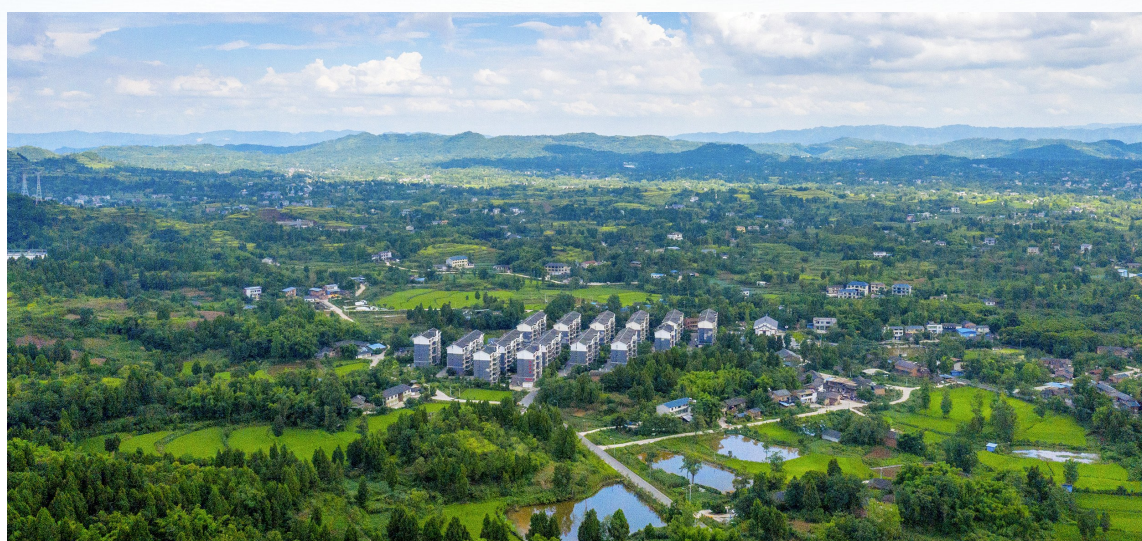
整洁靓丽的水峰社区。