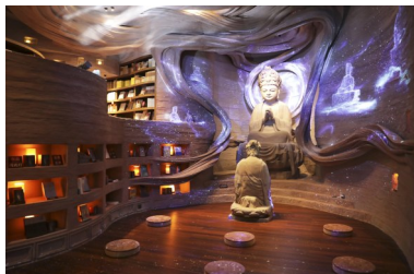
石窟艺术中的沉浸式心灵冥想秘境。