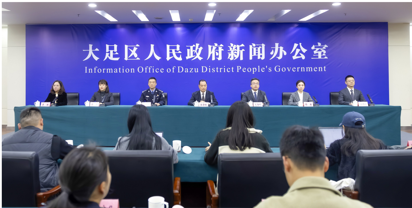
发布会现场。