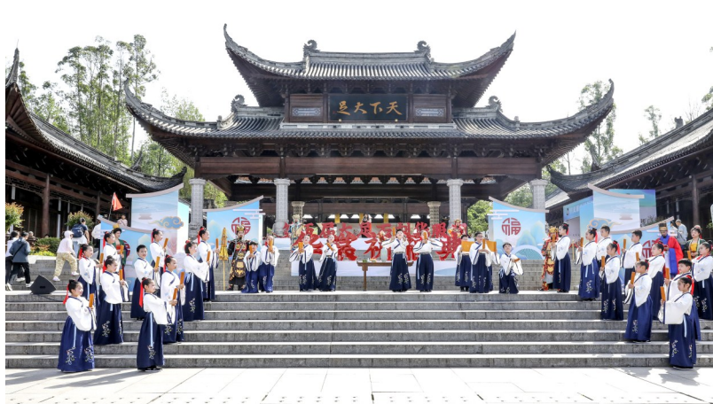
大足石刻华服周活动。

文体旅深度融合成为本届节会一大亮点。体育赛事方面,4月12日,龙水湖半程马拉松赛鸣枪开跑,60%赛段环湖而设,串联湖光山色与特色景观,打造生态最美湖畔赛道;4月17日至19日,全国汽车(房车)露营集结赛落地龙水湖,创新“定速拉力+趣味露营”模式,