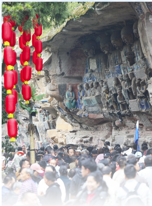
宝顶山石刻景区内，游客络绎不绝。